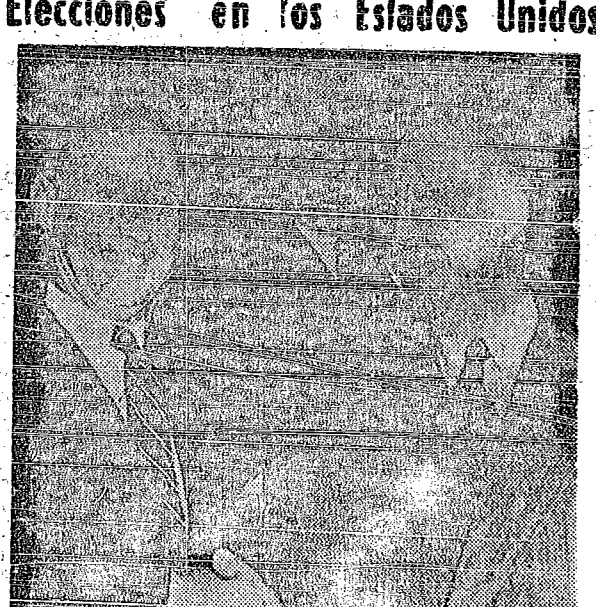
Mañana se celebrarán en Norteamérica las elecciones presidenciales que tanto interés han despertado en todo el mundo. En la fotografía, los dos candidatos, Eisenhower y Stevenson se estrechan cordialmente las manos. Claro que esto no ha ocurrido ahora sino la otra vez que fueron rivales, pero la escena puede repetirse, pues cualquiera que sea el vencedor, el derrotado acudirá a felicitarle por el triunfo

boral no dejará de recibir la bendita protección de San Rafael el gran Custodio ciudadano y la alta guía del